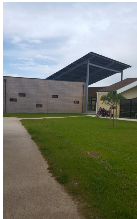
A l'extérieur, sur zone d'espace vert au centre du campus