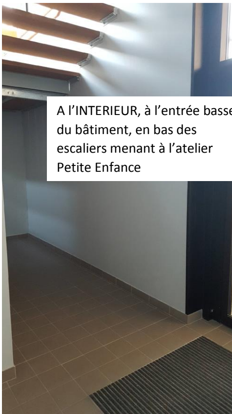
A L'INTERIEUR, à l'entrée basse du bâtiment, en bas des escaliers menant à l'atelier Petite Enfance