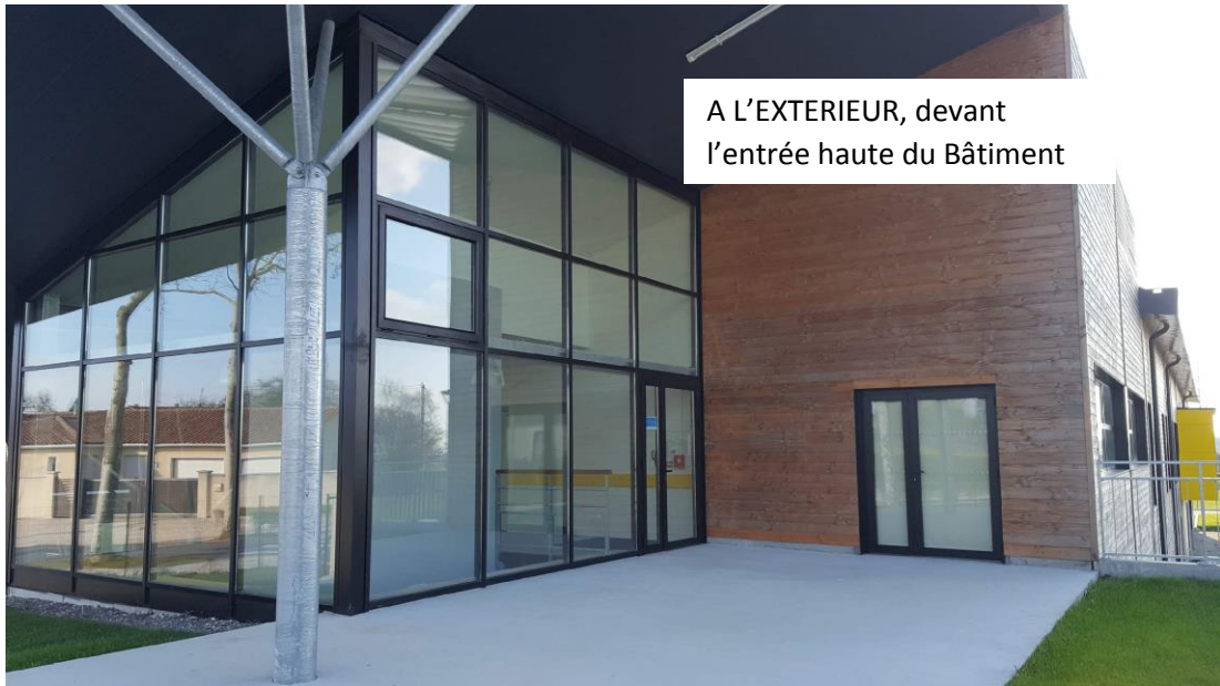
A L'EXTERIEUR, devant l'entrée haute du Bâtiment