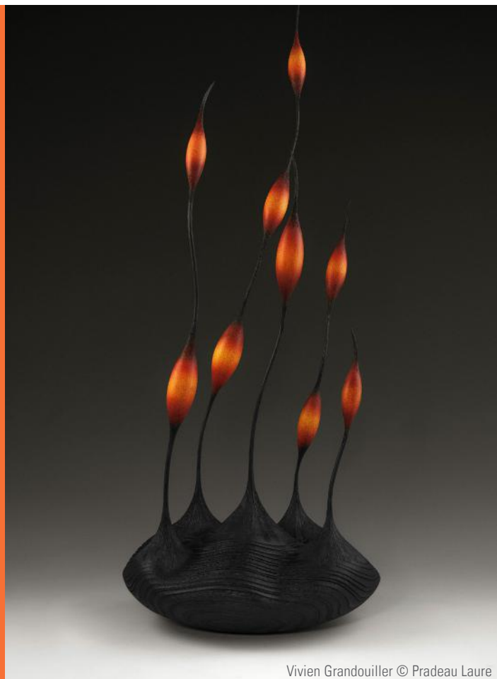
Vivien Grandouiller